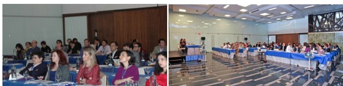
Vista panorámica de la sala y de los asistentes