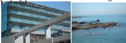
Imágenes del Parador atlántico y de la vista de la bahía de Cádiz

Se celebró en la hermosa ciudad de Cádiz y parece que todos los “astros” se conjugaron para que haya sido todo un éxito. Una sede idónea: el nuevo y remodelado Parador “Atlántico” con unas instalaciones magníficas y cómodas; unas fechas inmejorables que coincidieron con el último fin de semana del carnaval de Cádiz; buen tiempo para poder disfrutar por el día de un paseo por la playa y por las noches de las chirigotas y comparsas callejeras de la Viña.