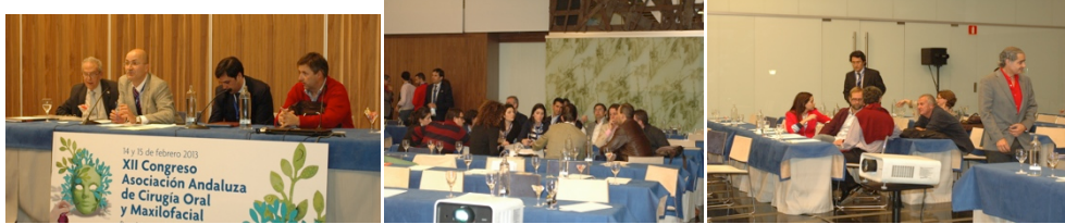
Junta Directiva, reunión de residentes, asistentes a la asamblea

A última hora del viernes tarde tuvo lugar las diferentes reuniones de la AACOMF y su Asamblea donde se presentó el próximo Simposium que tendrá lugar en Málaga, en los primeros meses de 2014, y que versará sobre Patología de las Glándulas Salivares. Asimismo el próximo Congreso tendrá lugar en Almería en 2015.