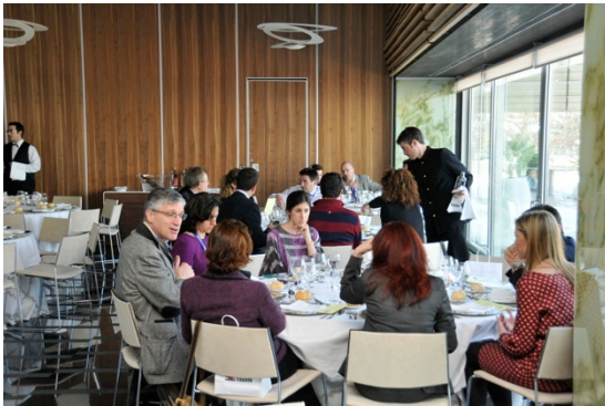
El potaje de jibia de la comida de trabajo fue alabado por todos