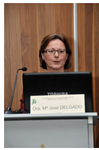
Dr. Galea del Hospital Carlos Haya de Málaga y Dra. Delgado del Hospital Virgen Macarena de Sevilla